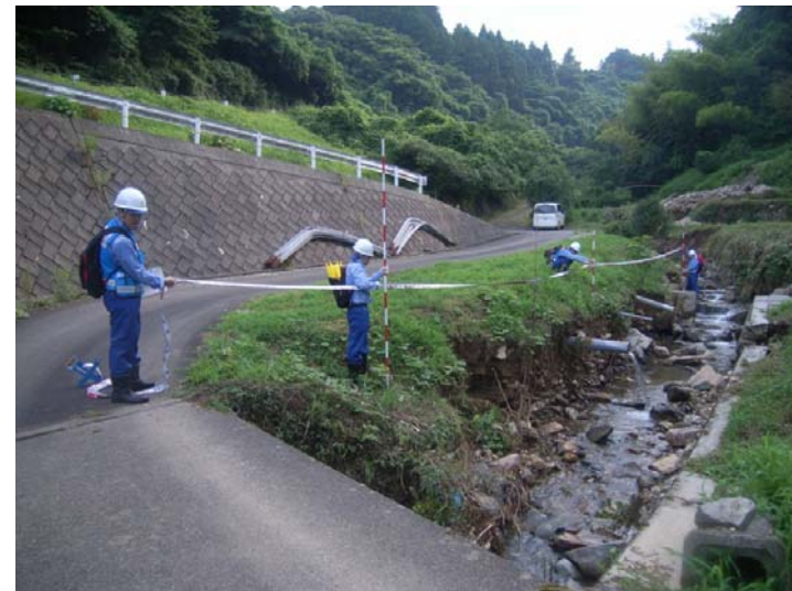
砂防班 被災箇所での現地調査