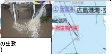
浸水対応のため排水ポンプ車の出動 【高津川派川南田川水門】