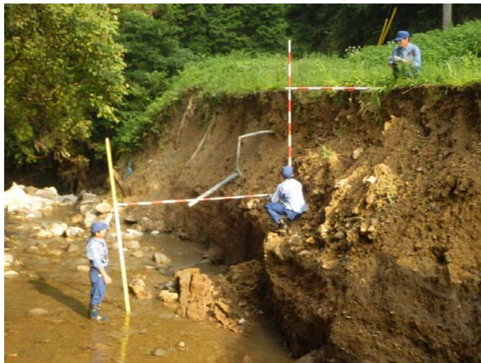
河川班 被災箇所での現地調査