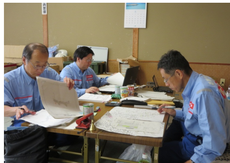
報告に向けた近畿地整の内業作業