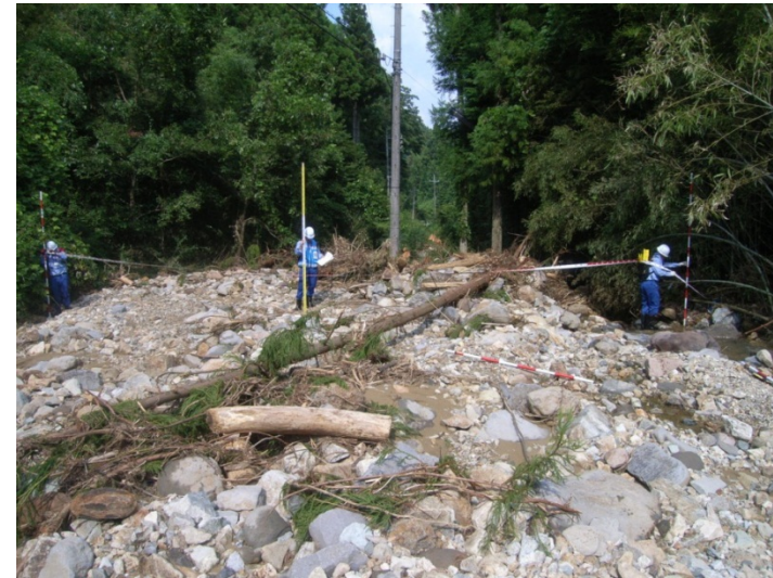
砂防班 被災箇所での現地調査