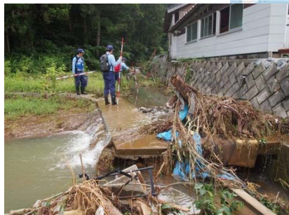
早期の災害復旧に向けた調査 【山口県萩市弥富(大田川)】