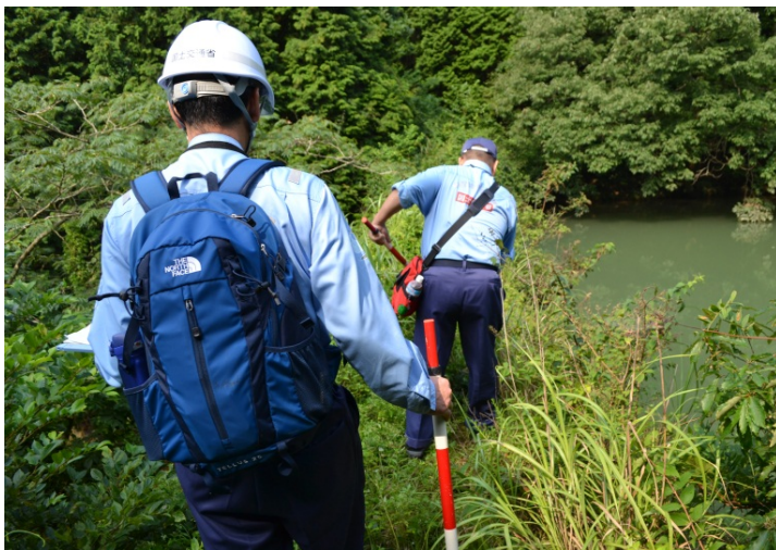
砂防班 草をかき分け堰堤の状況を確認