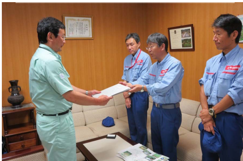
近畿地整TEC隊から津和野土木事業所長に結果報告