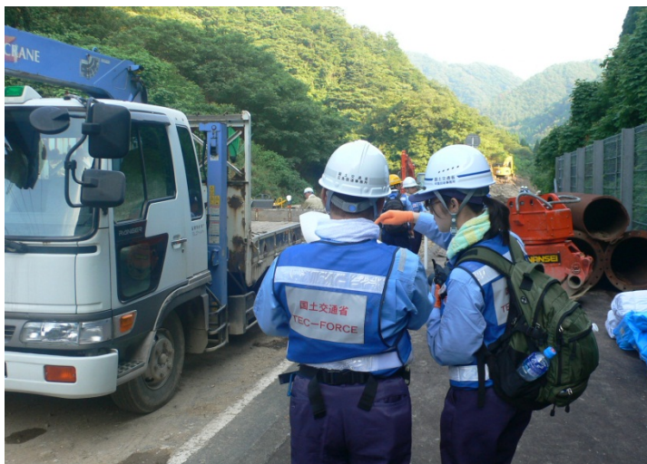
道路班 現地状況の確認