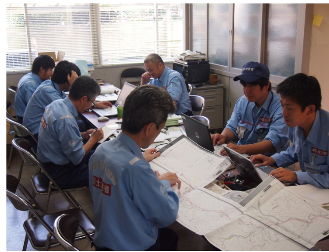
現地調査結果をまとめる道路班・砂防班