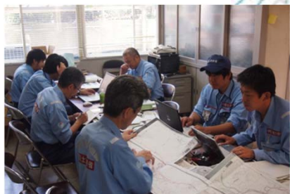
復旧に向け現地状況調査をまとめる 【山口河川国道事務所 萩出張所】