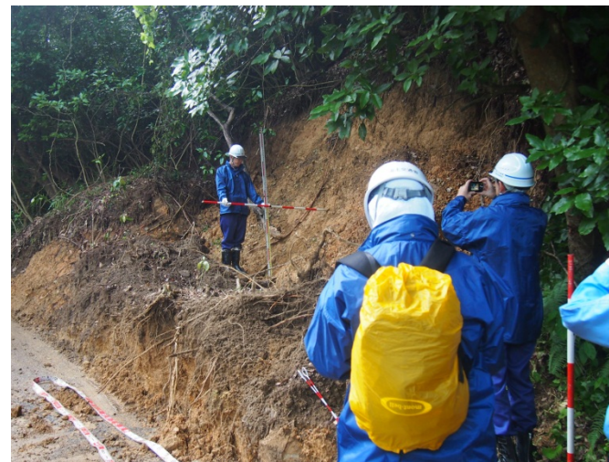
道路班 法面の被災状況調査