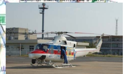
防災ヘリコプターによる (緊急) 被害状況調査