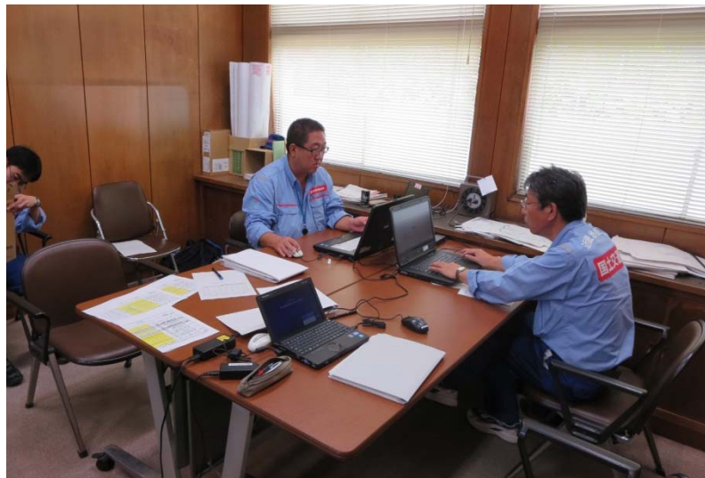
近畿地整の指令班の作業状況