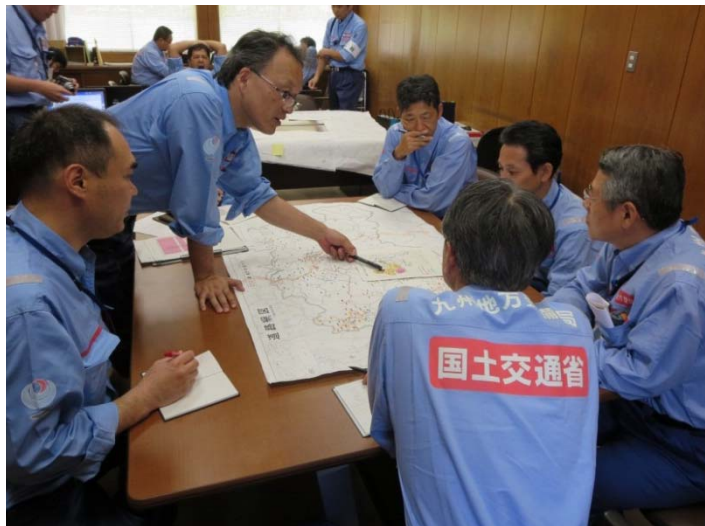
中国地整TECとの打合せ