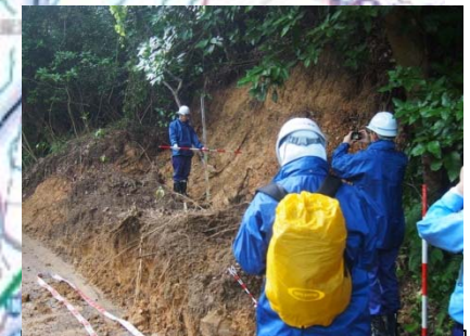
早期の災害復旧に向けた調査 【山口県萩市須佐町 (市道)】