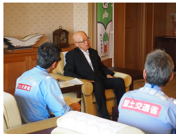
隊長達と話をされる山本知事