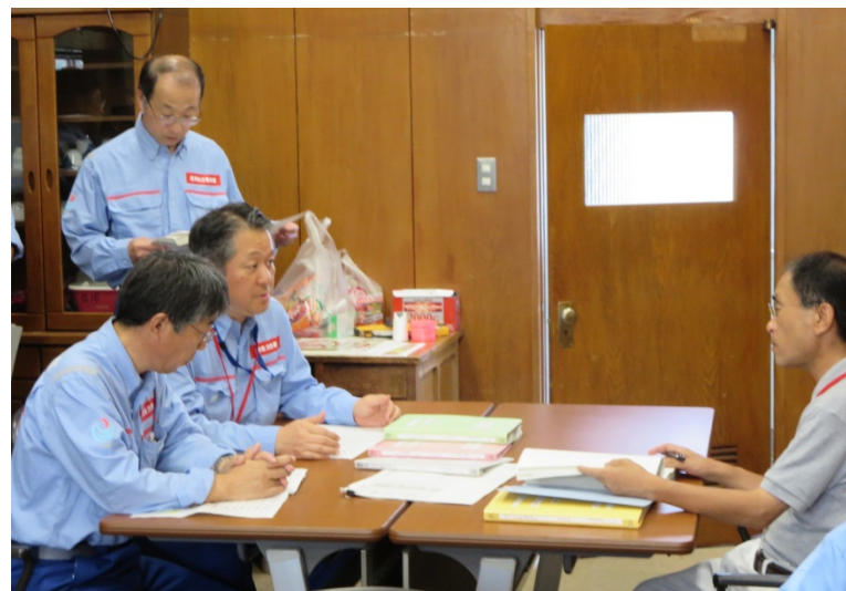
近畿地整TEC隊から津和野町職員に調査の概要説明