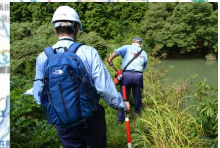
早期の災害復旧に向けた調査 【山口県萩市須佐町】