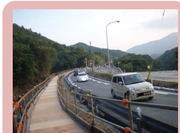
国道191号(萩市須佐) 通行可能 (8月5日 撮影)