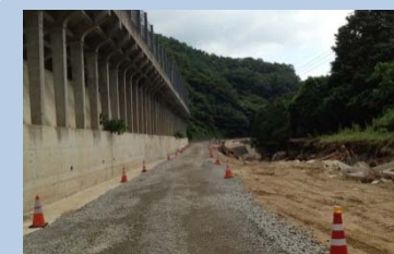
(主)萩津和野線(津和野町高峯) 通り抜けできません (8月6日 撮影)