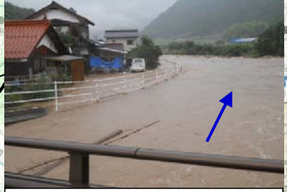
⑩島根県 高津川水系白上川支川上黒谷川