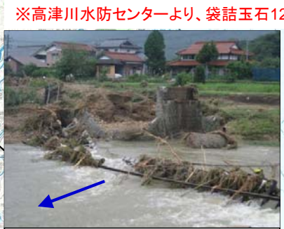
⑨島根県 高津川水系名賀川