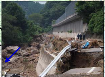
⑪島根県 高津川水系津和野川