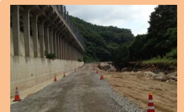
(主)萩津和野線(津和野町高峯) 8/9 15:00～ 大型車を除き、 一般車通行可能