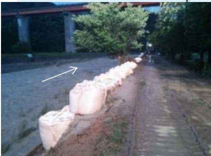
敬川水系敬川(応急復旧状況)