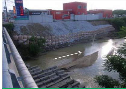
水尻川水系水尻川(応急復旧完成)

邑智郡川本町江の川水系濁川でJR三江線橋脚流出。濁川、奥谷川、水尻川、敬川で護岸等が崩落。