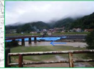
江の川水系濁川(護岸にシート張完了)