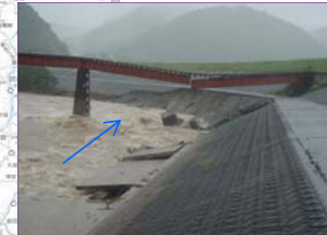
江の川水系濁川(JR三江線橋脚流出)