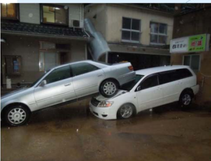
敬川水系湯路川(有福地区)