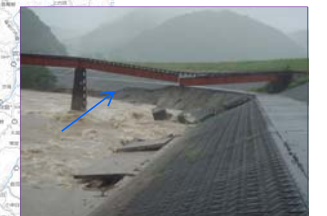
江の川水系濁川(JR三江線橋脚流出)