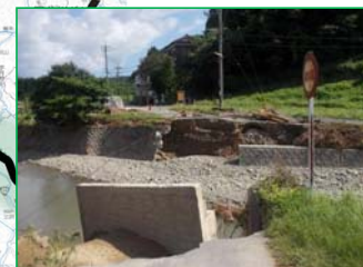
江の川水系奥谷川