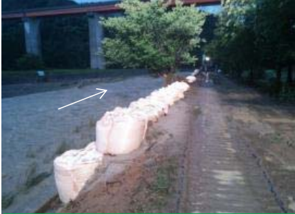
敬川水系敬川(応急復旧状況)