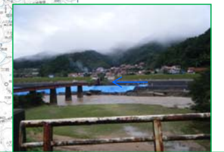
江の川水系濁川(護岸にシート張完了)