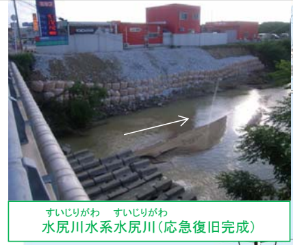
水尻川水系水尻川(応急復旧完成)

○直轄管理河川: 江の川を巡視の結果、被害が無いことを確認。 ごうつし はまだし おおちぐん おおなんちよう ごうつし ありふく ○島根県: 江津市、浜田市、邑智郡邑南町で浸水被害発生。詳細調査中。江津市有福温泉では床上浸水10戸、床下浸水20戸程度との情報。詳細は確認中。 ごうつし かわひら 江津市川平地区では床上浸水1戸、床下浸水7戸程度との情報。詳細は確認中。 おおちぐん かわもとちよう にごりかわ さんこうせん にごりかわ おくだにがわ すいじりがわ うやがわ 邑智郡川本町江の川水系濁川でJR三江線橋脚流出。濁川、奥谷川、水尻川、敬川で護岸等が崩落。