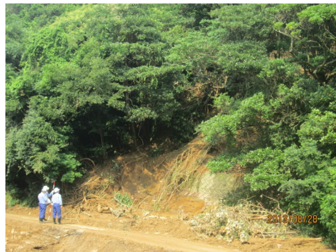
被災箇所の調査(国府24号線)