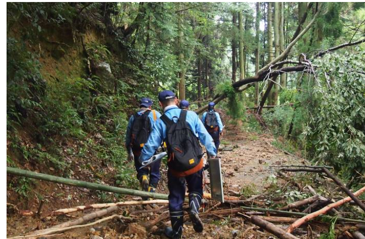
道路班 被災箇所へ向かうTEC-FORCE