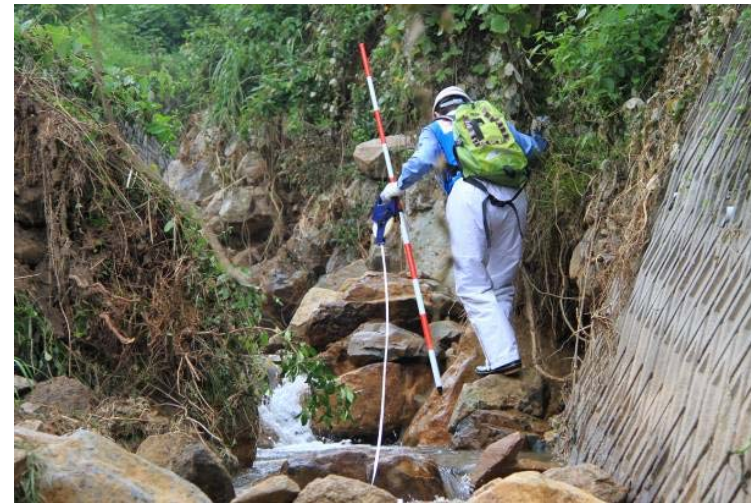
河川班 被災地の調査