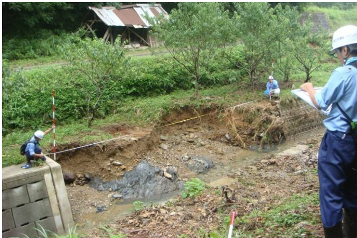
河川班 被災箇所計測(被災延長)