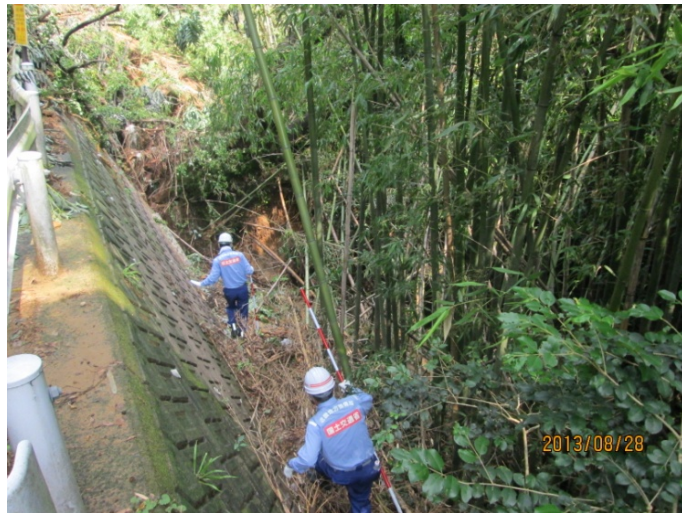
被災箇所の調査(下府久代線)