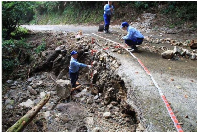
道路班 被災地の調査