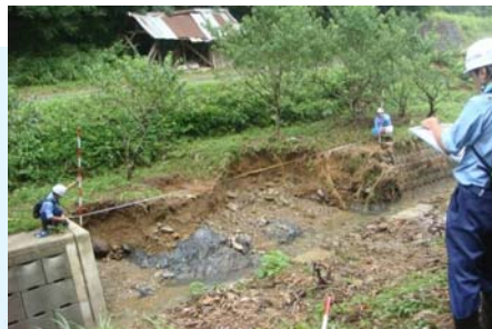
河川班による被災箇所での現地調査 (江津市 田ノ原川)