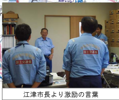
江津市長より激励の言葉