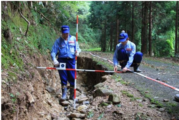
道路班 被災地の調査