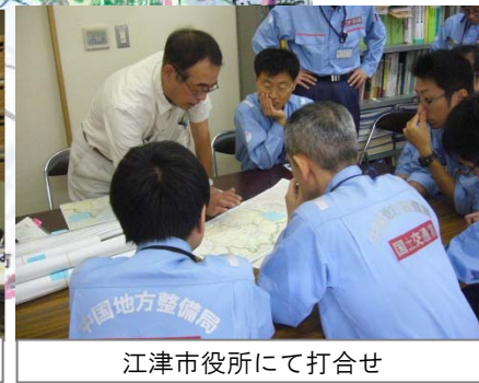
江津市役所にて打合せ