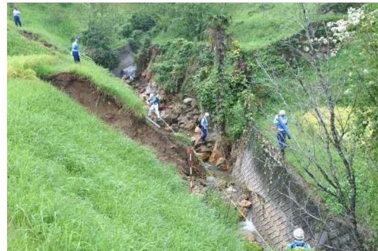
河川班 被災地の調査