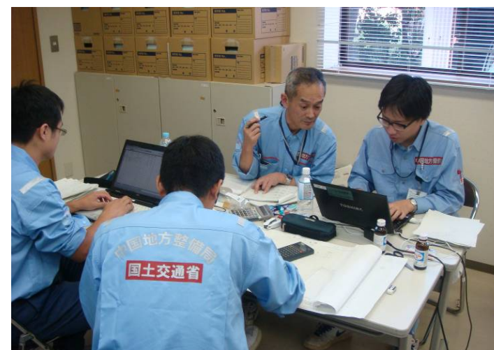
資料とりまとめ作業(道路班)