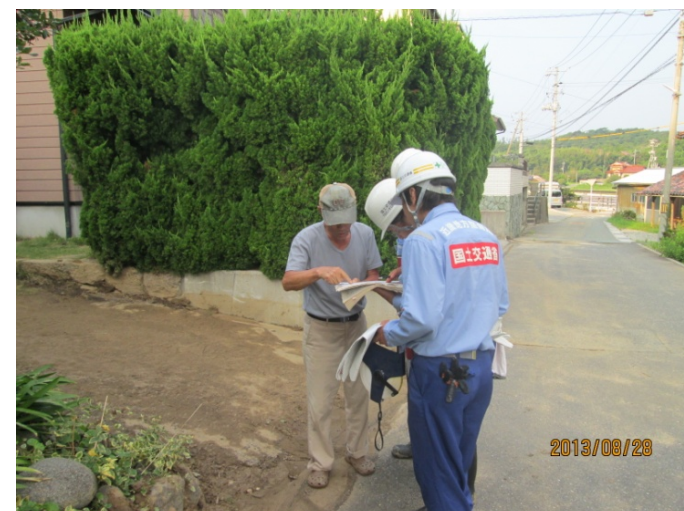
被災状況の聞き取り(国府2号線)