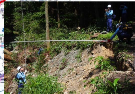
道路班による被災箇所での現地調査 (江津市 小田井沢線)