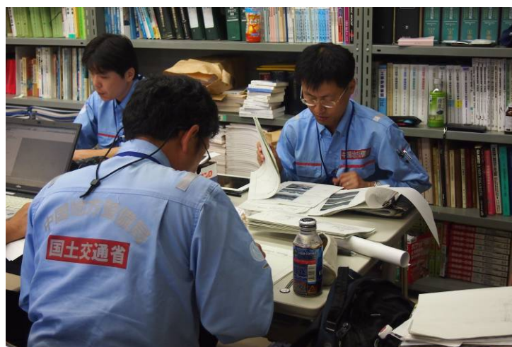
資料とりまとめ作業(河川班)