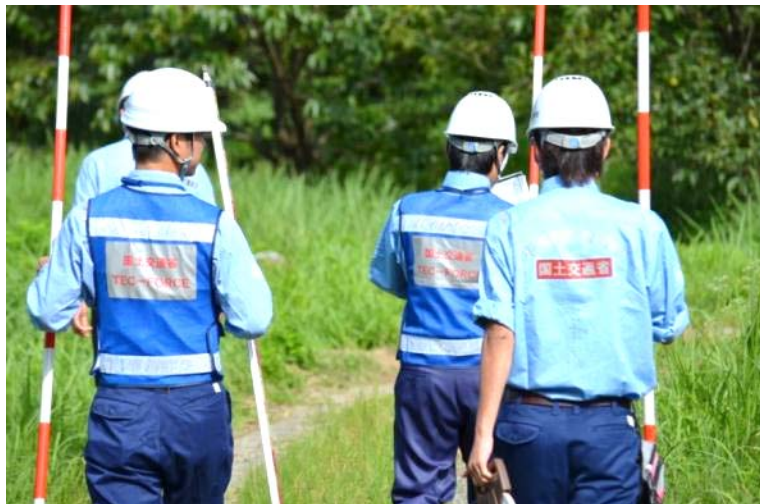
被災箇所に向かうTEC隊員(江津市山の内川)