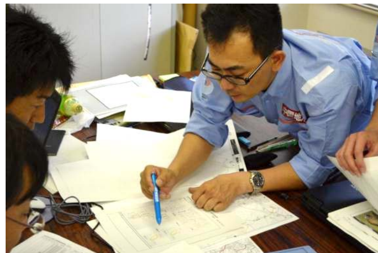
邑南町役場にて被災額算定作業