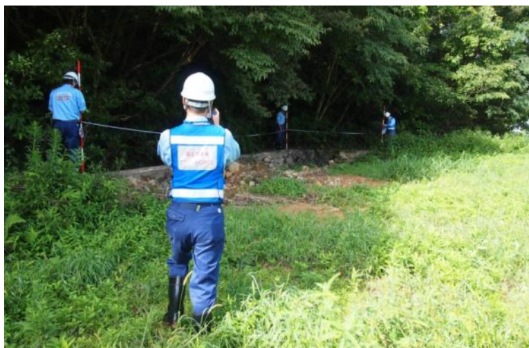
被災状況調査 被災箇所の測量(江津市山の内川)