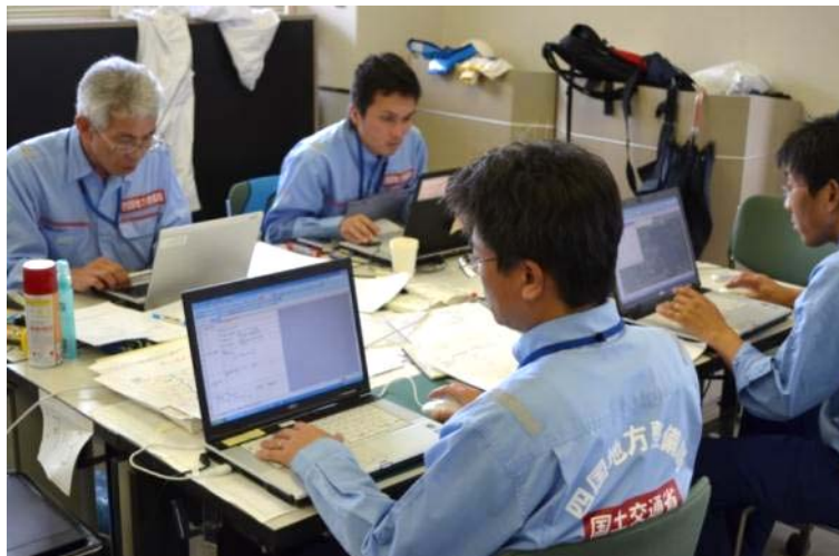
邑南町役場にて被災額算定作業