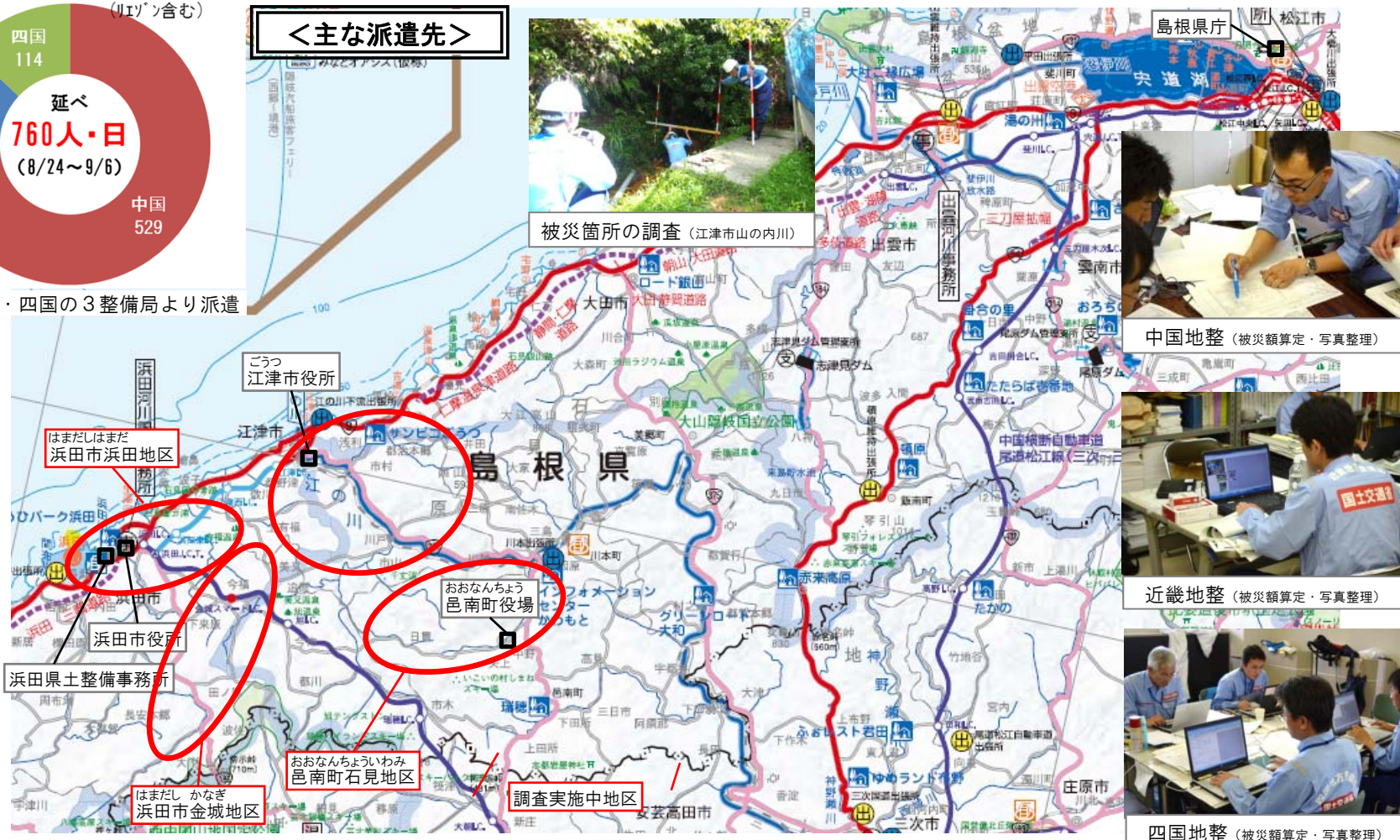
四国地整 (被災額算定・写真整理)