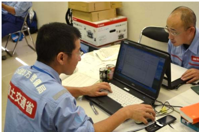
江津市役所にて被災額算定作業