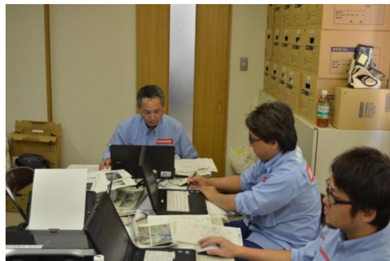
江津市役所にて被災額算定作業