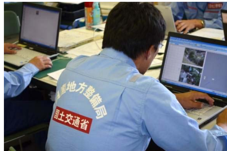
邑南町役場にて被災状況写真整理