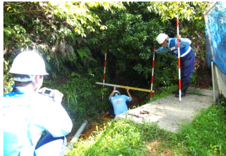
被災状況調査 被災箇所の測量(江津市山の内川)