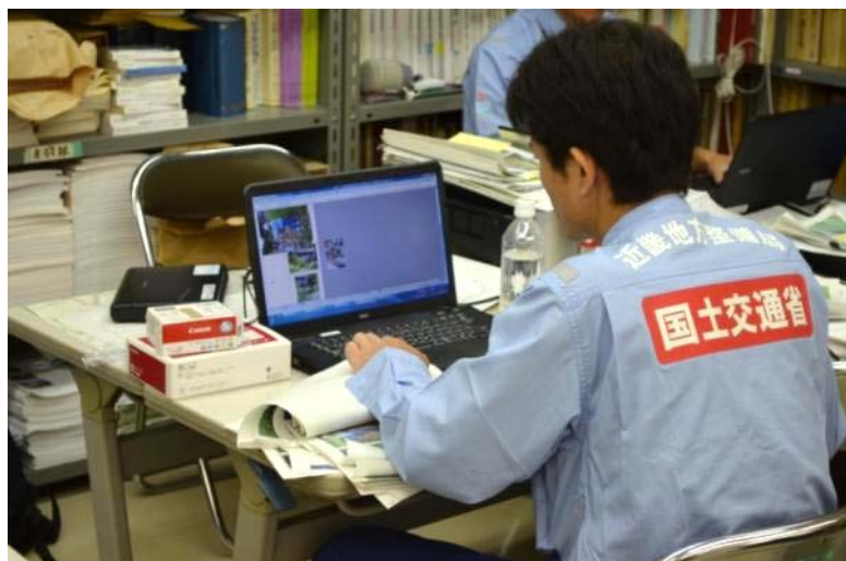
江津市役所にて被災額算定作業