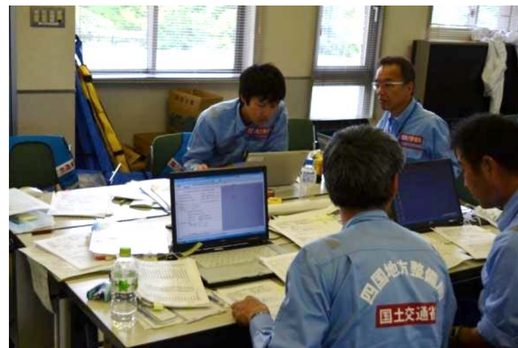
邑南町役場にて被災額算定作業