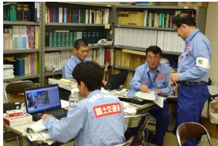
江津市役所にて被災額算定作業