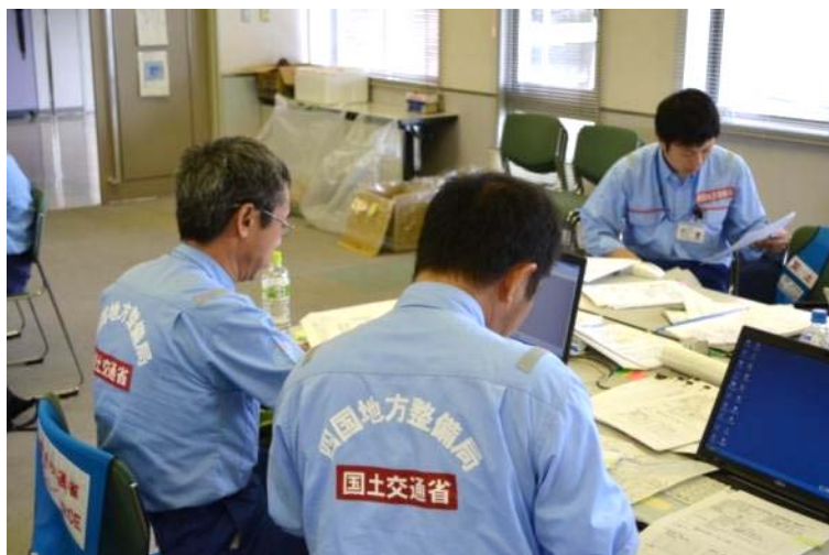
邑南町役場にて被災額算定作業