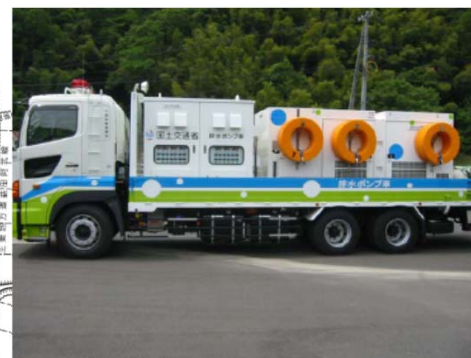
排水ポンプ車 (30m 3 /分)