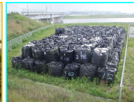
大型土のう 280袋搬出