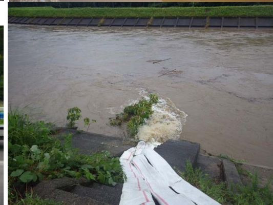
排水ポンプ車作業状況