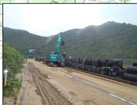
大型土のう搬入状況