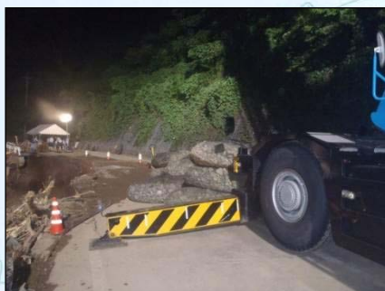
袋詰め玉石設置状況