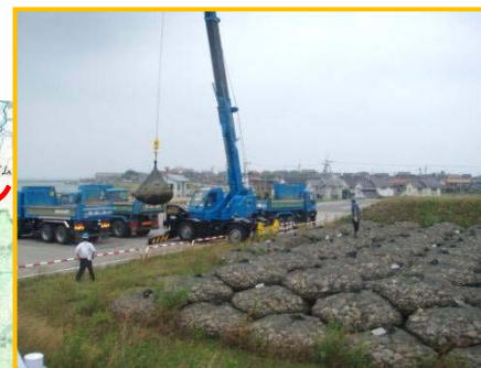
袋詰め玉石(2t)120袋搬出