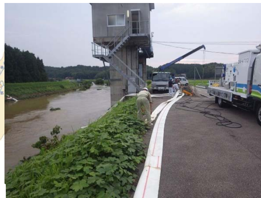
排水ポンプ車設置状況