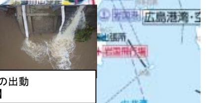
浸水対応のため排水ポンプ車の出動【高津川派川南田川水門】