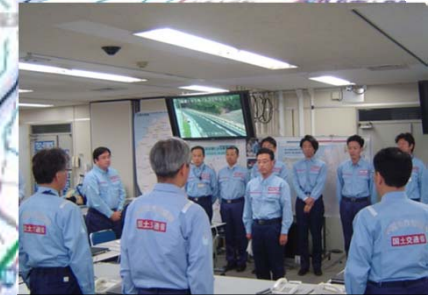
第5 TEC-FORCE (地域支援班) 隊員の出発【中国地方整備局 (災害対策室)】