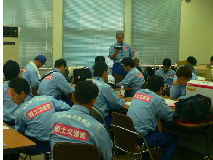
最後の打合せを行うTEC-FORCE隊員