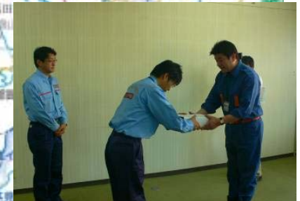
津和野町長へ被災状況調査成果を報告【津和野町役場】