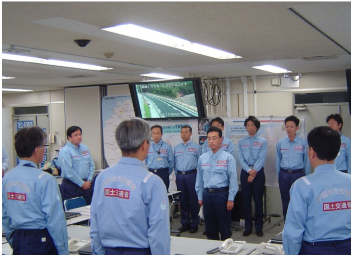
中国地整 第5TEC-FORCE（地域支援班）隊員の出発 8月12日（月）17時30分出発