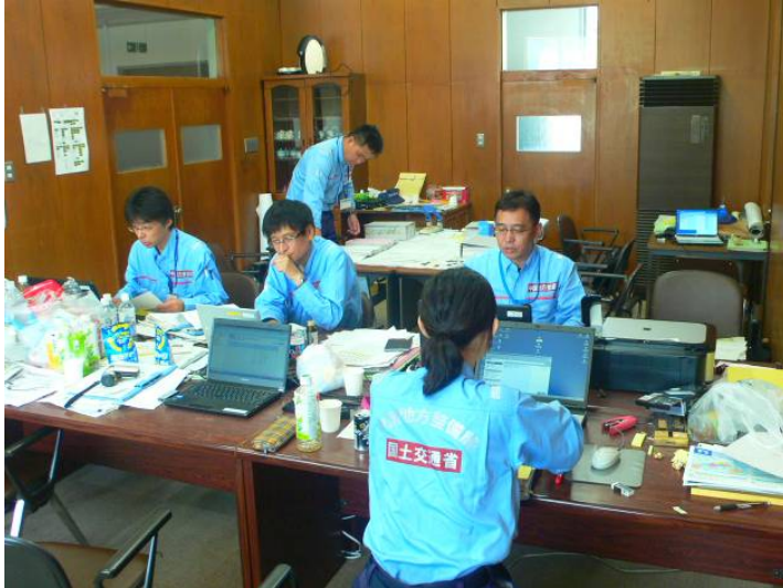
調査成果をまとめる中国地整TEC-FORCE隊員