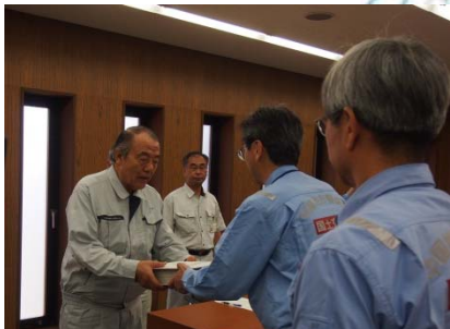
萩市長へ被災状況調査成果を報告【萩市役所】