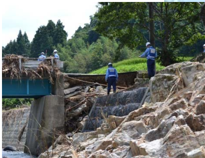
早期の災害復旧に向けた調査【山口県萩市 (被災橋梁の調査)】