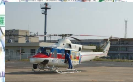
防災ヘリコプターによる (緊急) 被災状況調査