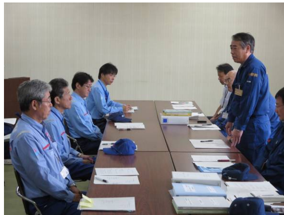
益田県土整備事務所長のお礼の言葉