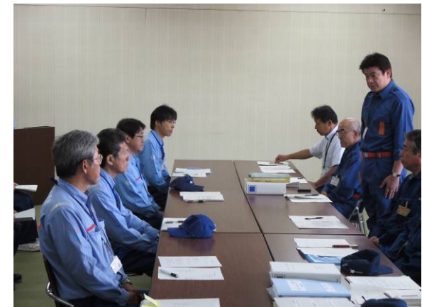
津和野町長のお礼の言葉