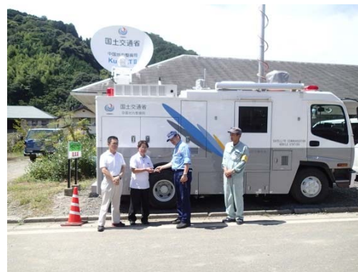
●和木町への衛星通信車引き渡し 【山口県玖珂郡和木町瀬田】