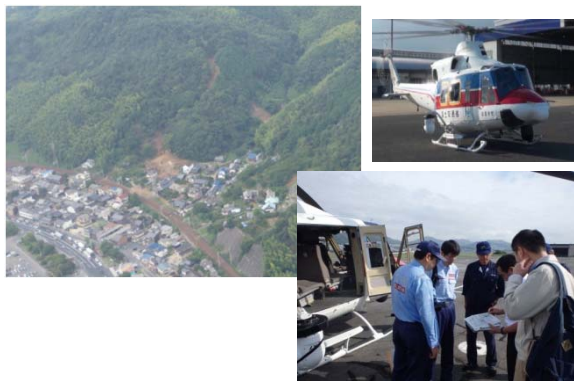
●ヘリコプターによる上空からの被災状況調査 【空撮写真は山口県岩国市新港町上空】