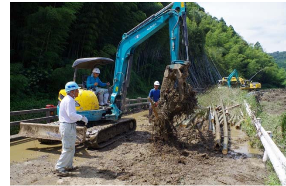
●土砂・倒木等の撤去状況 【山口県玖珂郡和木町瀬田】