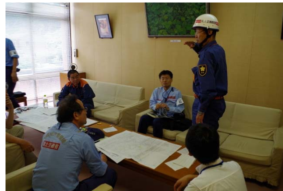
●リエゾンによる地元消防団等からの被災状況確認 【和木町役場】