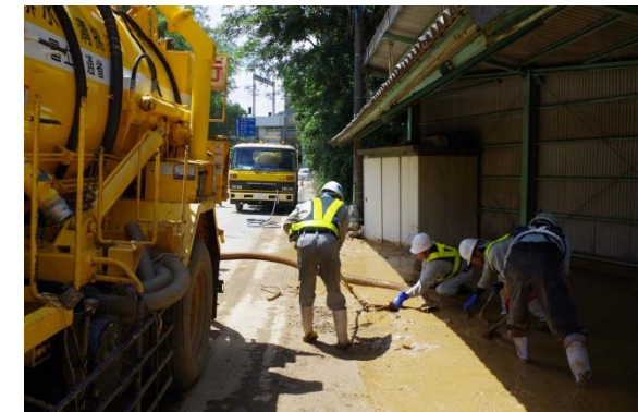
●国道2号土砂撤去状況 【山口県岩国市上多田】