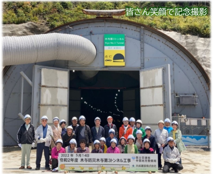
皆さん笑顔で記念撮影