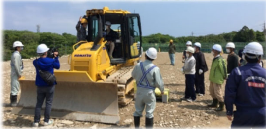
ブルドーザーに試乗