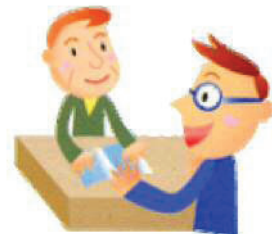
補償金額等の説明