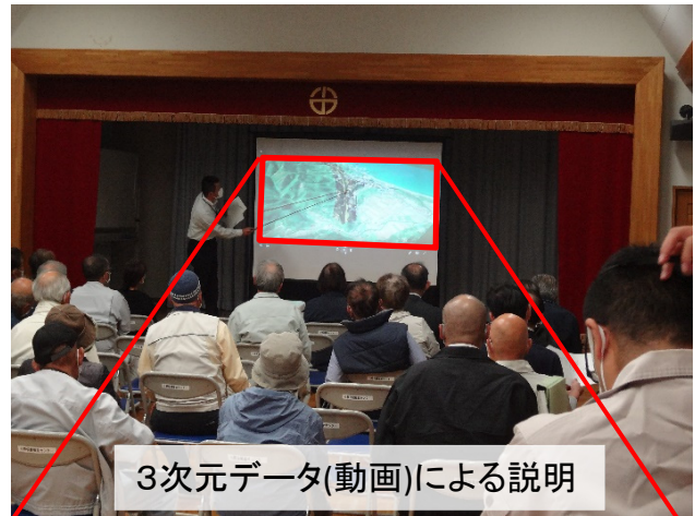
3次元データ(動画)による説明