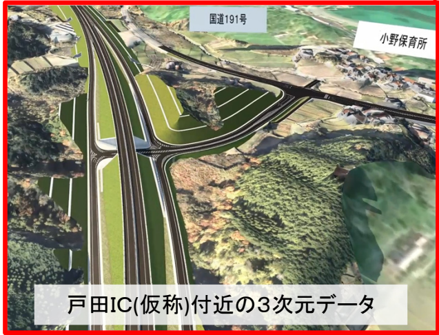
戸田IC(仮称)付近の3次元データ