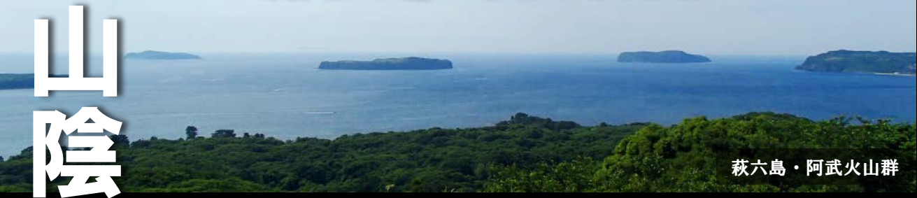
萩六島・阿武火山群