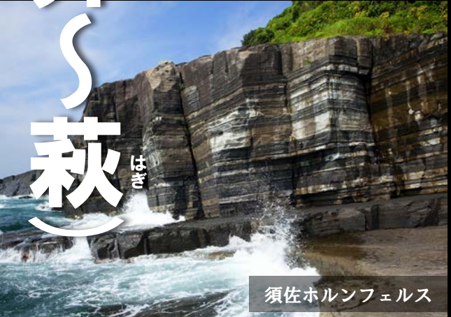
須佐ホルンフェルス