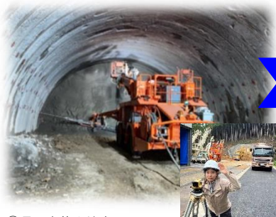
①長門市俵山地区内 工事名: 第1トンネル工事 (別紙-1参照)