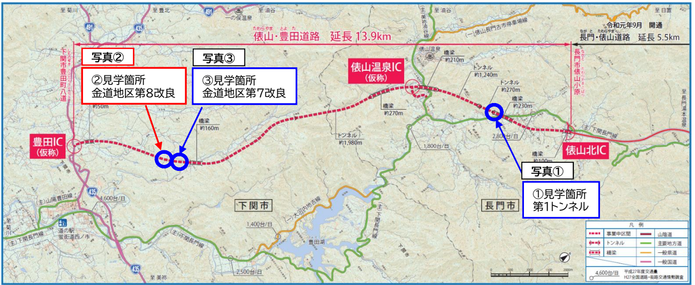
写真② ②見学箇所 金道地区第8改良