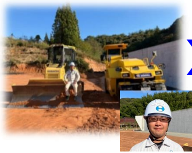
②下関市豊田町金道地区内 工事名: 金道地区第8改良工事 (別紙-2参照)