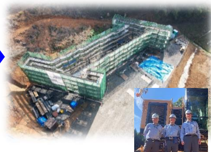
③下関市豊田町金道地区内 工事名: 金道地区第7改良工事 (別紙-3参照)

※取材に当たっては駐車場の準備がございますので、別紙-4に記入のうえ 12月8日(金)13時までにFAXにて送信願います。