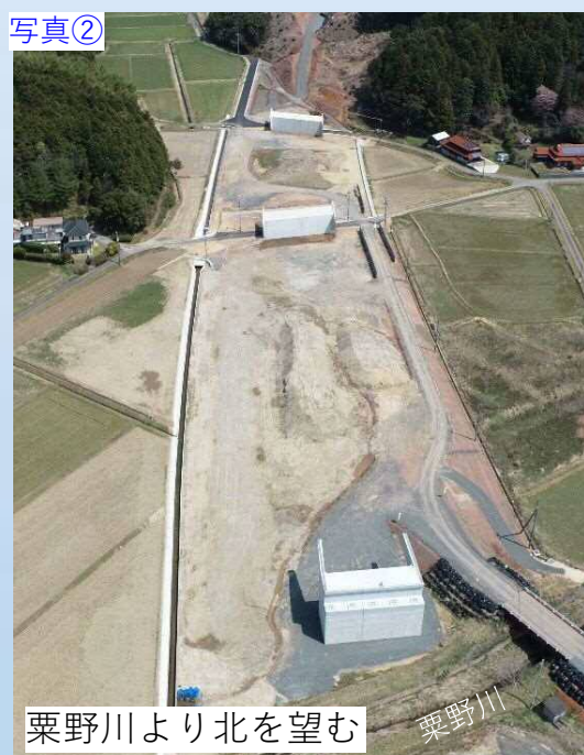
写真② 栗野川より北を望む