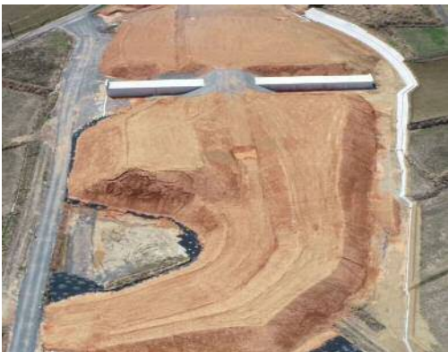
①上八道地区第3改良工事【完成】 【工事内容】盛土