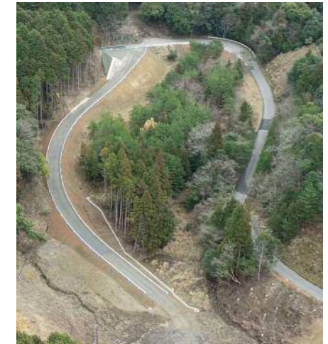
④-3 豊田地区工事用道路工事【完成】 【工事内容】工事用道路