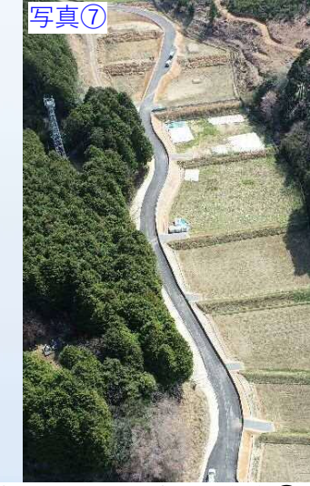
写真⑦ 豊田地区 工事用道路③ 状況