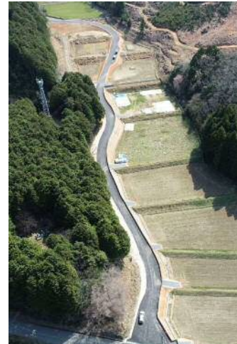
④-2 豊田地区工事用道路工事【完成】 【工事内容】工事用道路