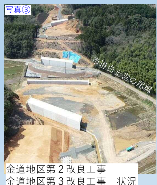
写真③ 金道地区第2改良工事 金道地区第3改良工事 状況