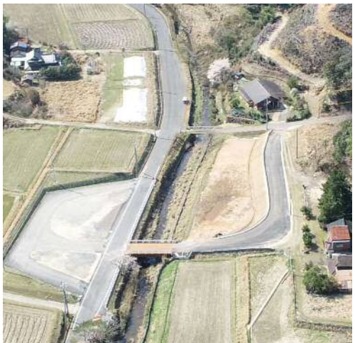
④-1 豊田地区工事用道路工事【完成】 【工事内容】工事用道路