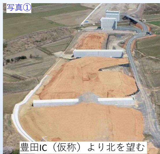
写真① 豊田IC (仮称) より北を望む