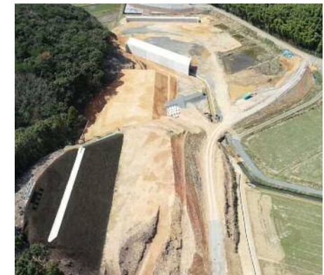
③金道地区第3改良工事【完成】 【工事内容】切土、盛土、ボックスカルバート