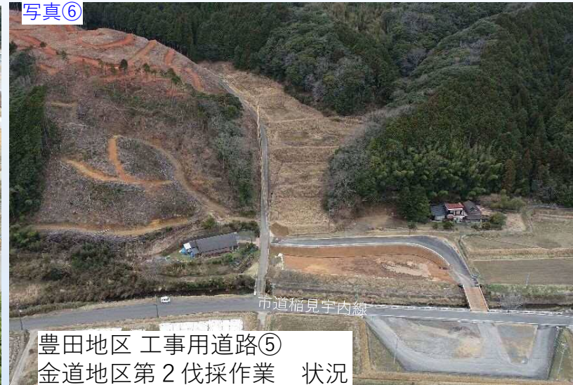
写真⑥ 豊田地区 工事用道路⑤ 金道地区第2伐採作業 状況