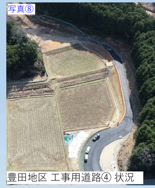
写真⑧ 豊田地区 工事用道路④ 状況