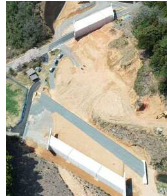
②金道地区第2改良工事【完成】 【工事内容】ボックスカルバート