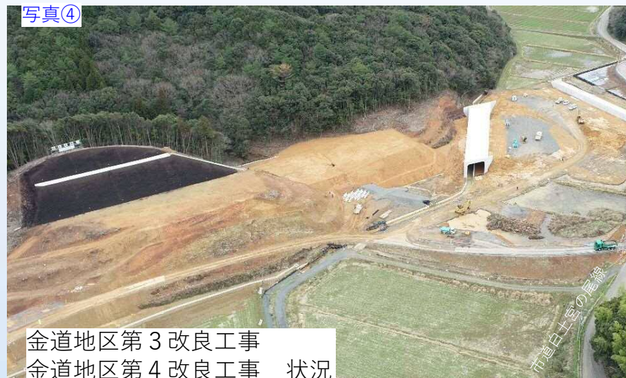
写真④ 金道地区第3改良工事 金道地区第4改良工事 状況