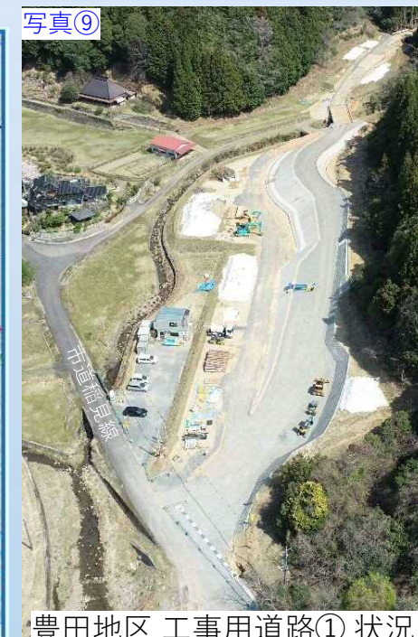
写真⑨ 豊田地区 工事用道路① 状況