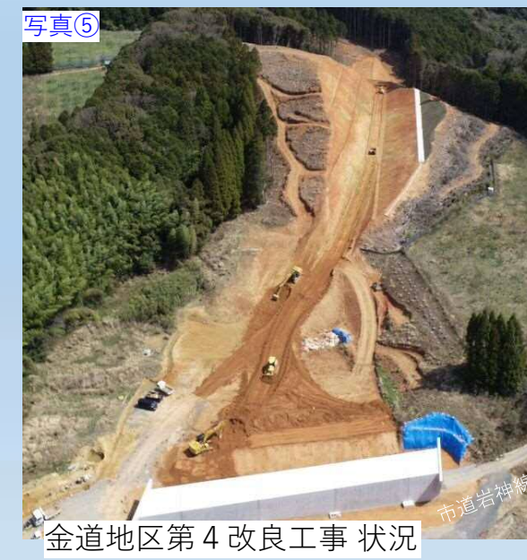
写真⑤ 金道地区第4改良工事 状況