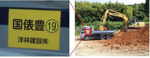
⑱ 依山・豊田道路金道地区第6改良工事

車両識別表示 依山・豊田道路の作業車両には下記車両識別表示板を設置して運行いたします。 表示数字は本紙裏面の工事別番号となります。