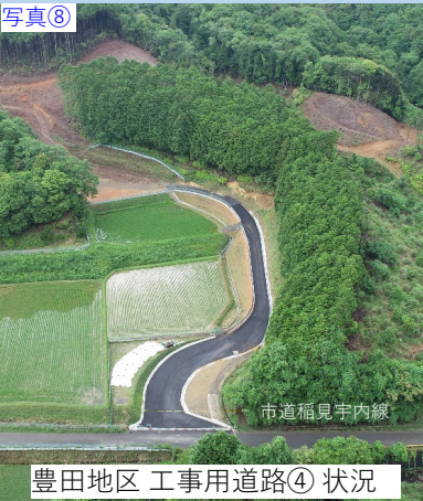
写真⑧ 豊田地区 工事用道路④ 状況