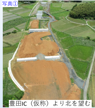
写真① 豊田IC (仮称) より北を望む