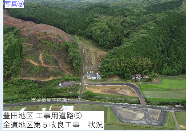
写真⑥ 豊田地区 工事用道路⑤ 金道地区第5改良工事 状況