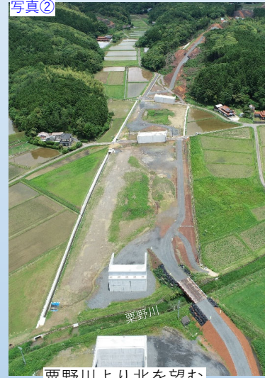
写真② 栗野川より北を望む