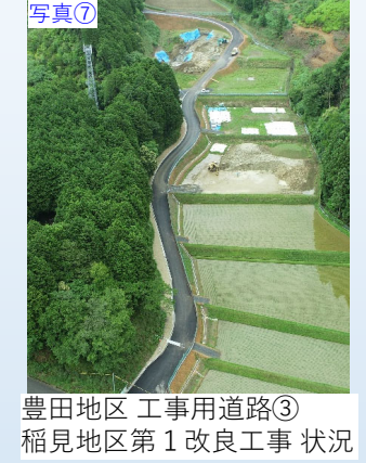
写真⑦ 豊田地区 工事用道路③ 稲見地区第1改良工事 状況