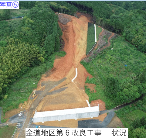
写真⑤ 金道地区第6改良工事 状況