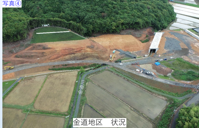
写真④ 金道地区 状況