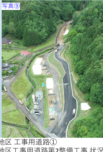
写真⑨ 豊田地区 工事用道路第2整備工事 状況