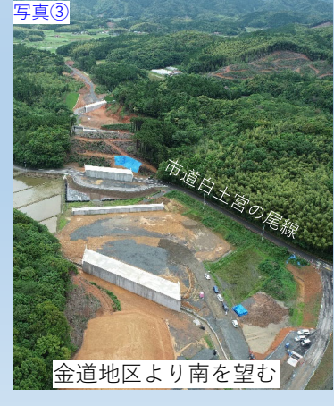
写真③ 金道地区より南を望む