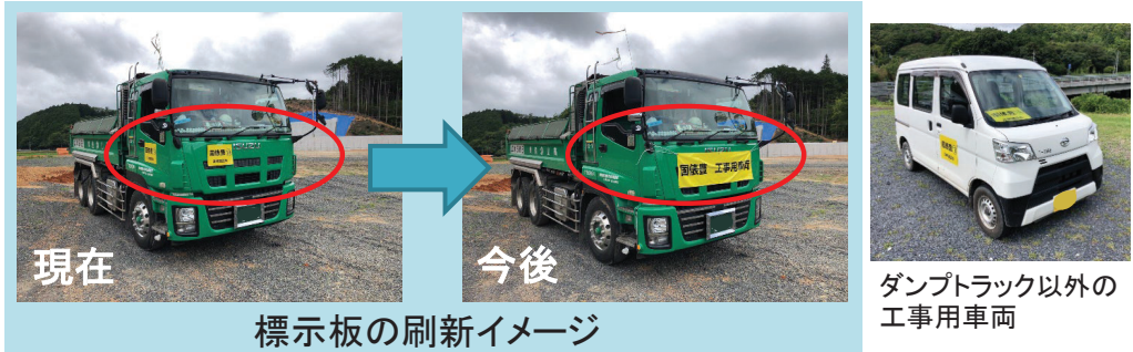
標示板の刷新イメージ