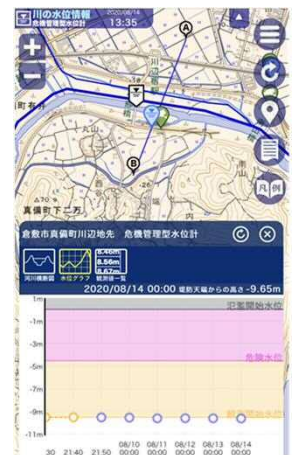
【川の水位情報】(危機管理型水位計) スマートフォン表示画面

国土交通省 高梁川・小田川緊急治水対策河川事務所 電話 086-697-1020