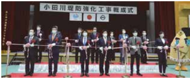
テープカットの様子

国が実施している堤防強化工事は、令和4年3月26日（土）に概成式を挙行了しました。