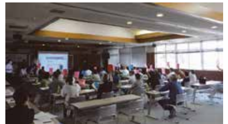
意見交換会・ワークショップの実施状況