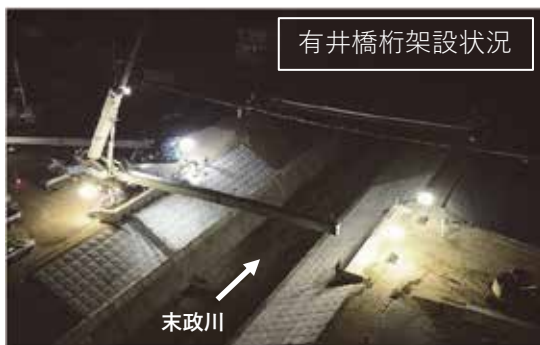
有井橋の桁架設は現地状況を考慮して夜間に行いました。