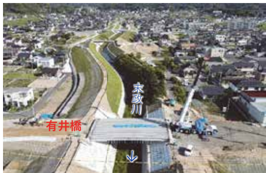
上記写真は、末政川の有井橋周辺の施工状況（7月中旬）です。