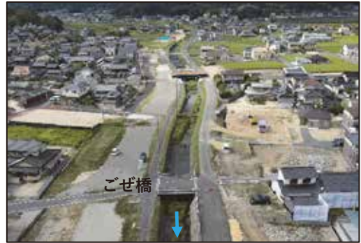
ごぜ橋周辺の進捗状況