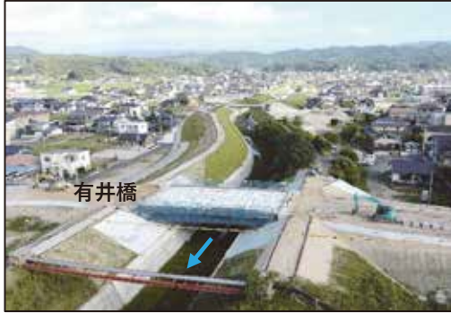
有井橋周辺の進捗状況