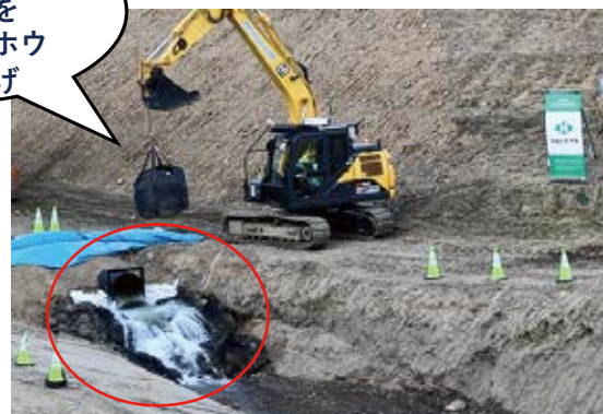
当日の通水の様子