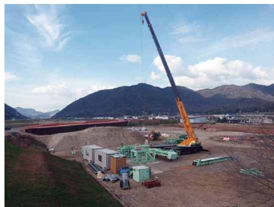
盛土材改良プラント設置状況

◎国土交通省中国地方整備局を中心とする調査担当者会議のメンバーによる現地視察が12月13日(木)にあり、荒締切堤撤去後の堤体底部の状況確認をされました。