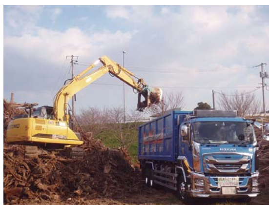
伐木搬出状況【伐木積込機械：(左)バケットホーク仕様、(右)ピラニアバケット仕様】

◎伐木等を撤去した造成地で、新年1月9日より、築堤盛土用土砂の改良を行うプラントの設置工事に着手しました。本格的な築堤工事に取り掛かる予定です。