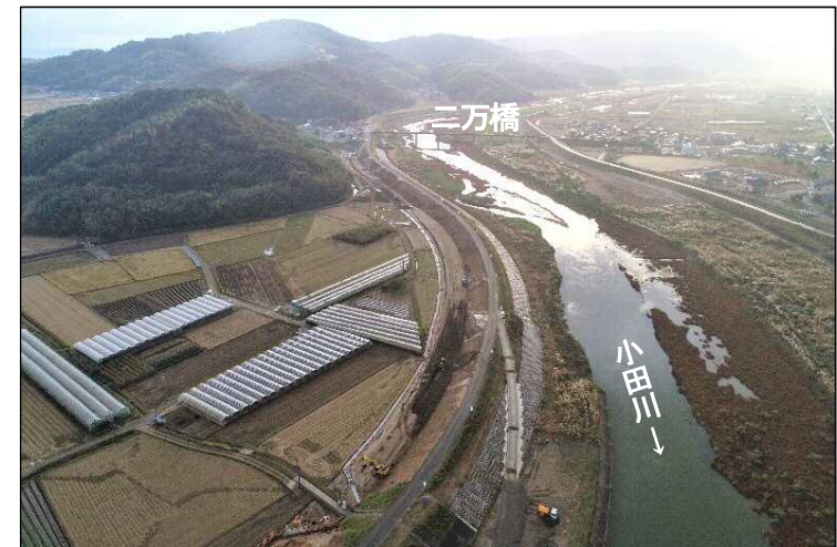
②堤防強化区間(下流より望む)