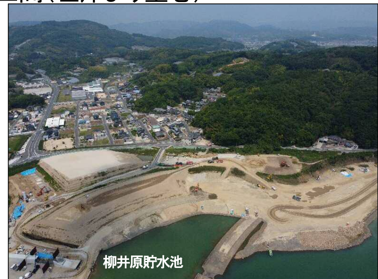
③築堤区間(左岸より望む)