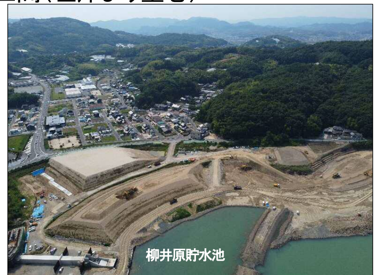
③築堤区間(左岸より望む)