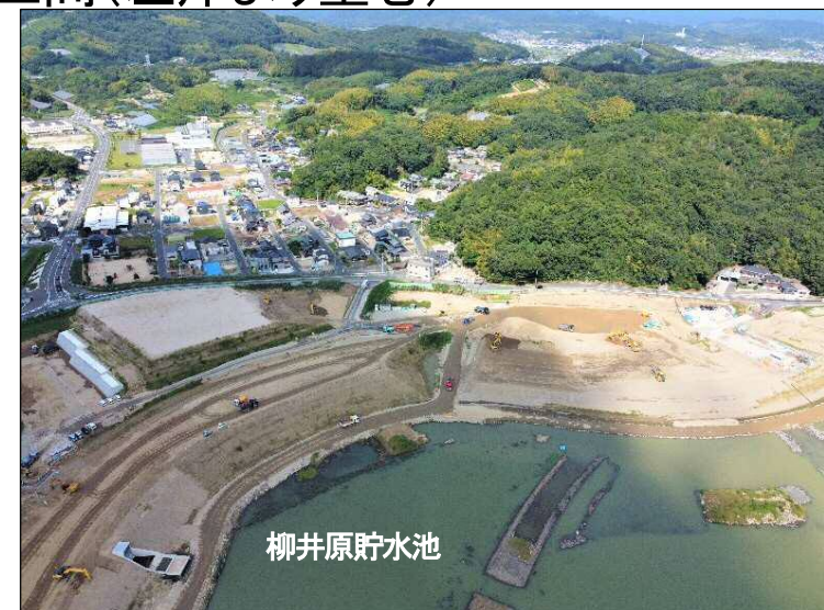
③築堤区間(左岸より望む)