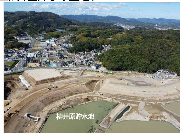
③築堤区間(左岸より望む)