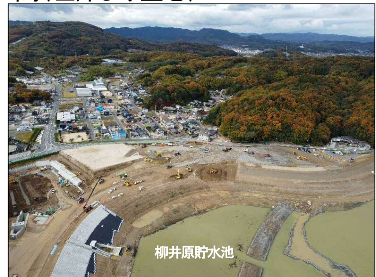
③築堤区間(左岸より望む)