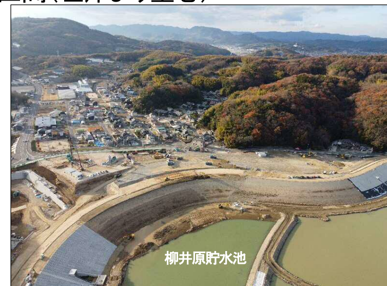
③築堤区間(左岸より望む)