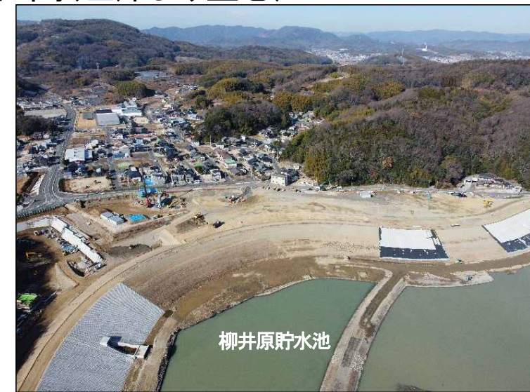
③築堤区間(左岸より望む)