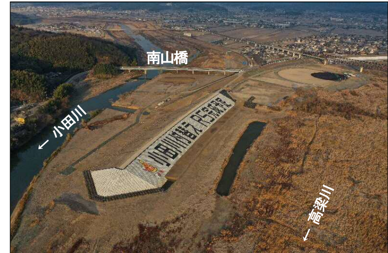
③高梁川から見た上流締切堤防