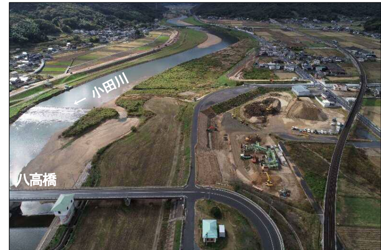
③堤防強化区間(下流より望む)