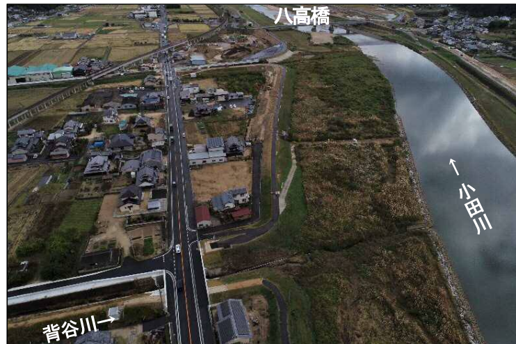
②堤防強化区間(上流より望む)