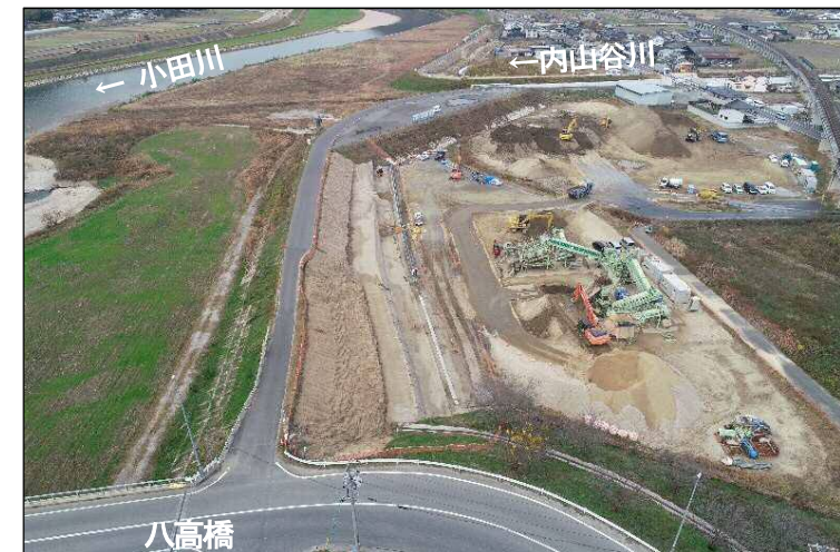
③堤防強化区間(下流より望む)