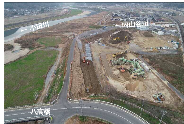
③堤防強化区間(下流より望む)