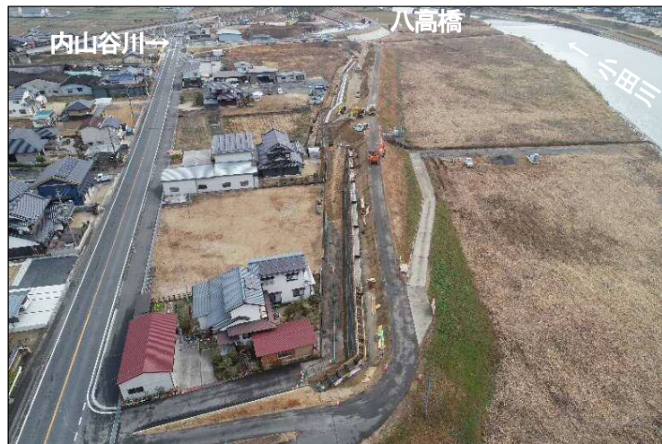
②堤防強化区間(上流より望む)