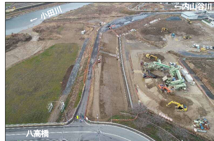
③堤防強化区間(下流より望む)