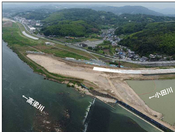
②護岸施工区間(高梁川より望む)