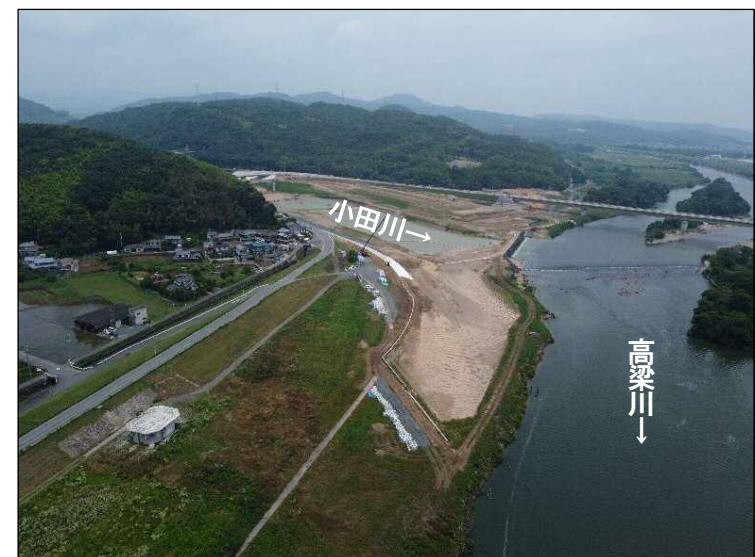
③護岸施工区間(高梁川より望む)