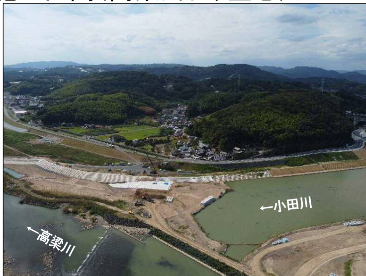
②護岸施工区間(高梁川より望む)