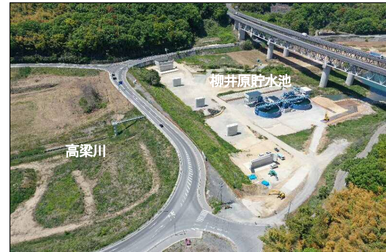
②貯水池左岸から見た橋梁