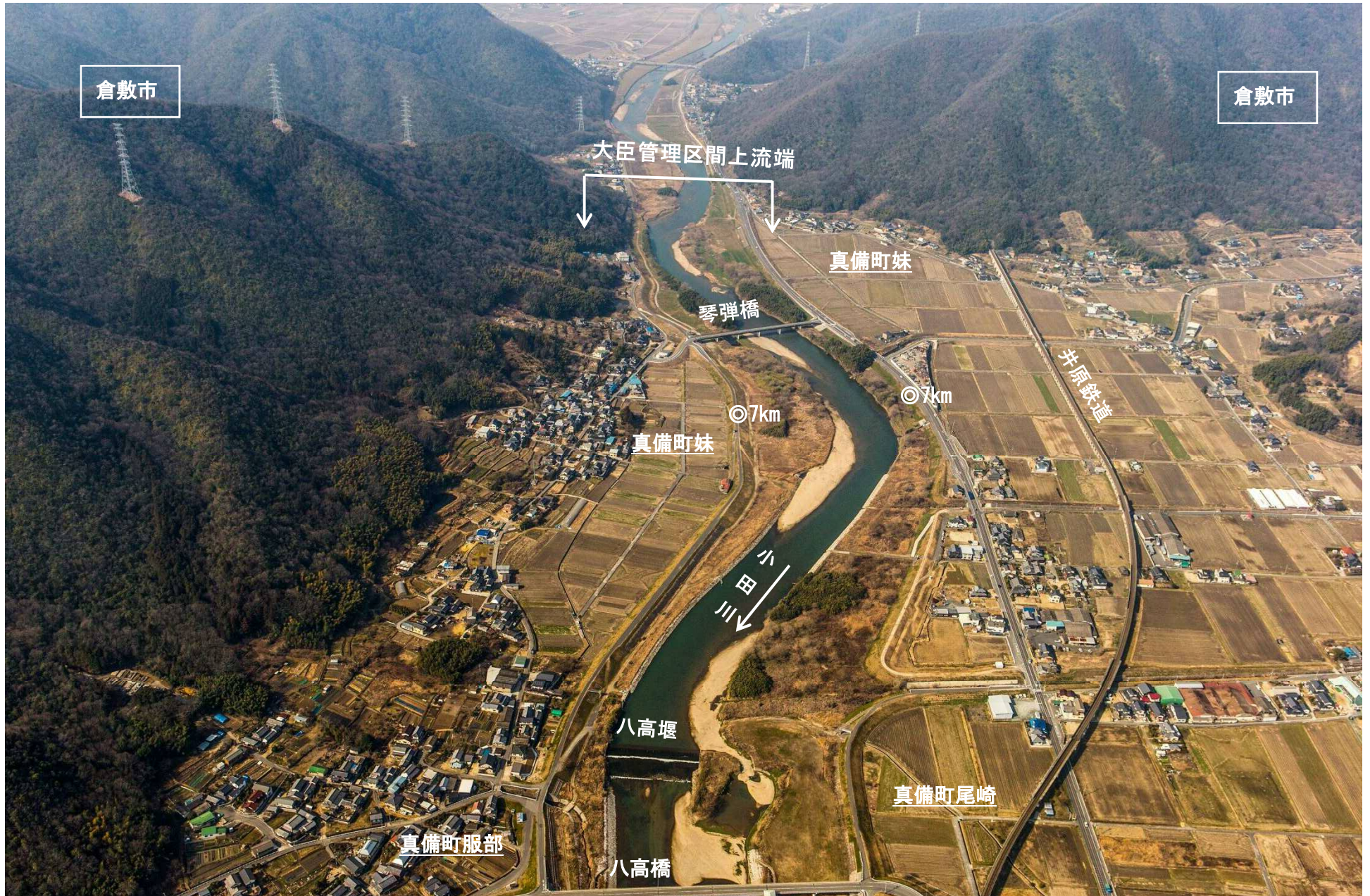
小田川 23 6 km ~7km 付近 (大臣管理区間上流端付近)