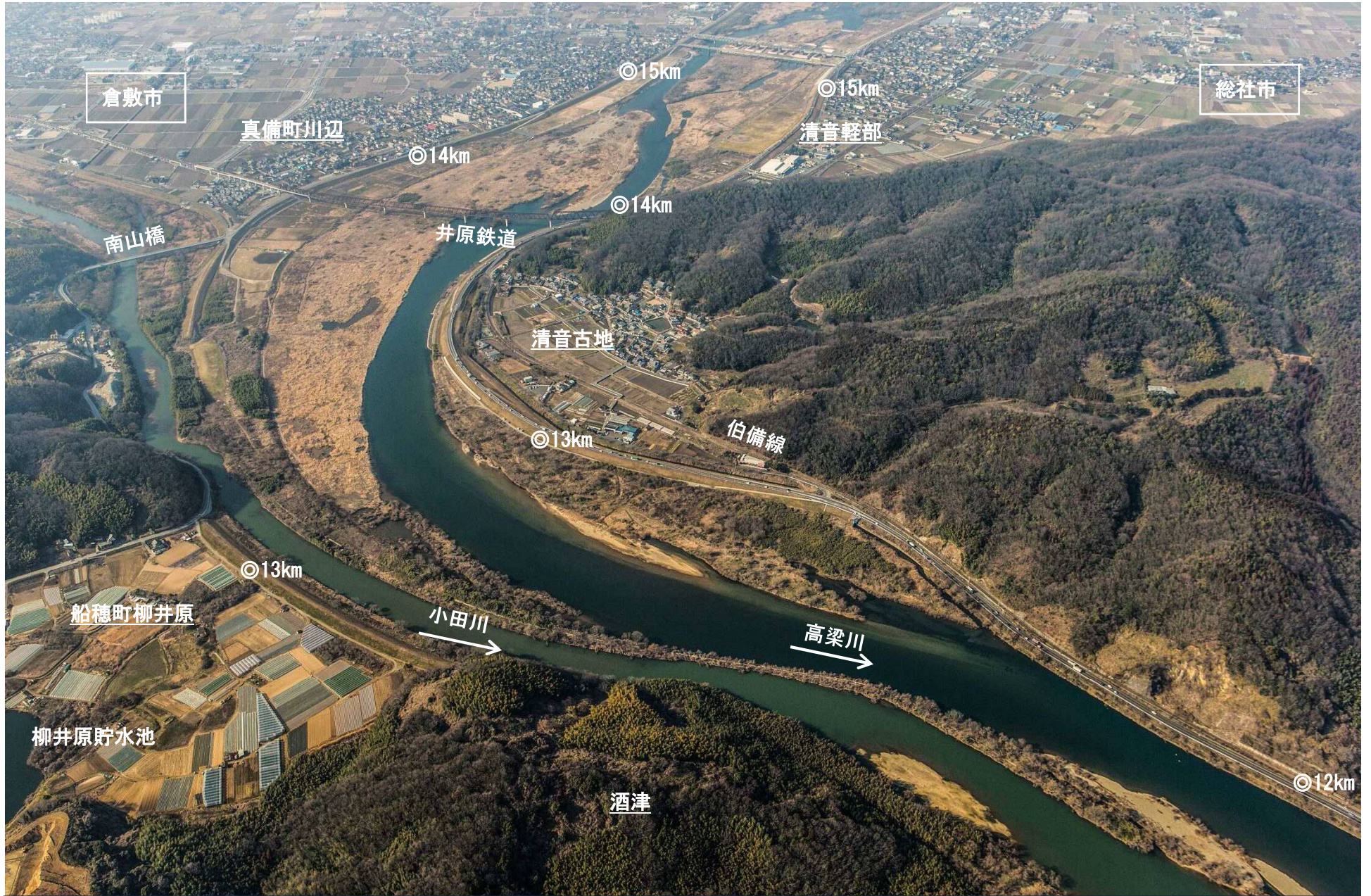
高梁川 6 12 km ~ 15 km 付近 撮影 平成25年2月