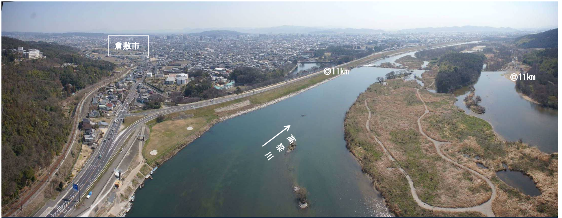
高梁川 34 11 km ~ 12 km 付近詳細