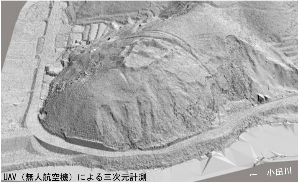
図2 南山城跡全体拡大図（北東上空より）