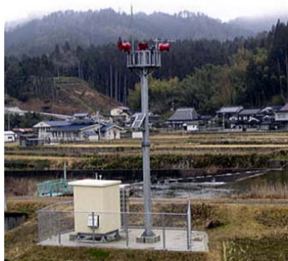
警報所のサイレン・スピーカ