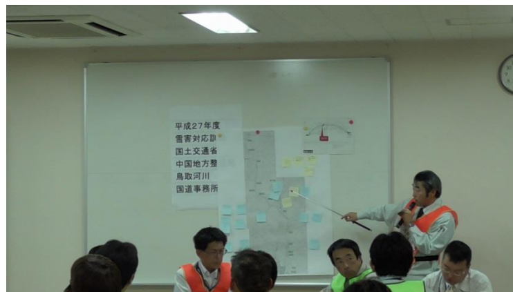
路線毎に抽出した問題点の発表