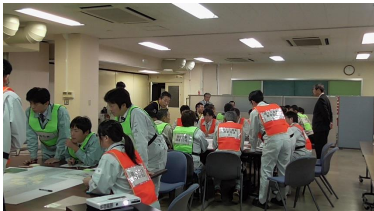
路線に関係する機関が集まり 「雪害状況把握」「対応策」「役割確認」「問題点抽出」