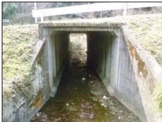
写真：特定の条件を満足する溝橋の定期点検に関する参考資料