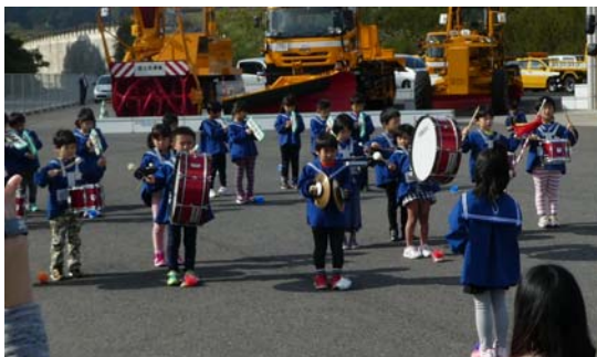
幼稚園児からの激励