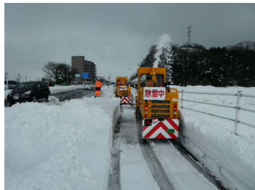
小型ロータリ除雪車 ※歩道に溜まった雪を 取り除く機械