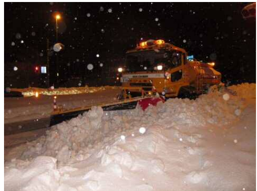
除雪トラック ※雪を取り除く機械