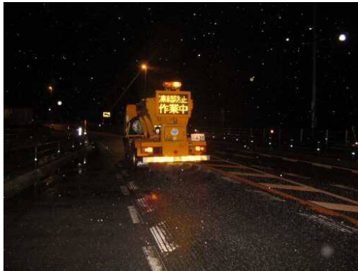
凍結防止剤散布車 ※凍結防止剤を散布する 機械