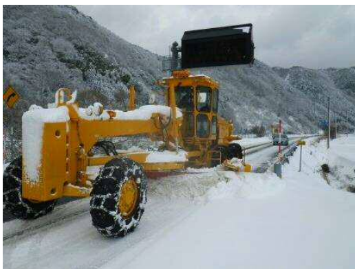
除雪グレーダ ※締め固った雪を取り 除く機械