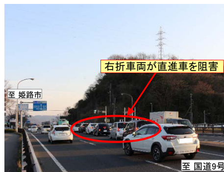
【写真】現在の状況(国体道路交差点を姫路方面を望む)