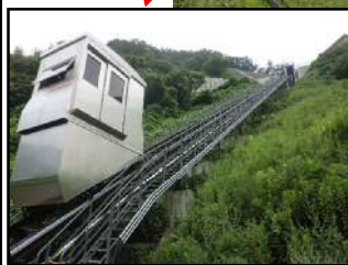
ケーブルカー（インクライン）