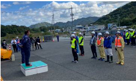
保守業者決意表明