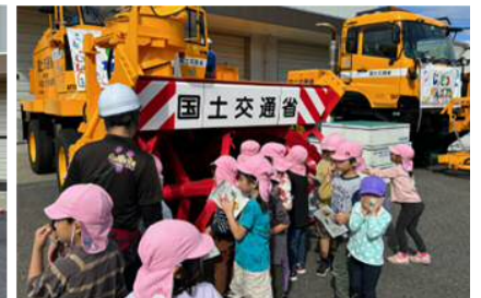
除雪機械ふれあい体験