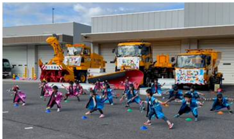
園児によるなるこ踊り